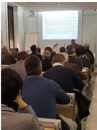
Foto 2 – Corso in materia di costi della sicurezza presso Ordine Ingegneri Teramo -2019