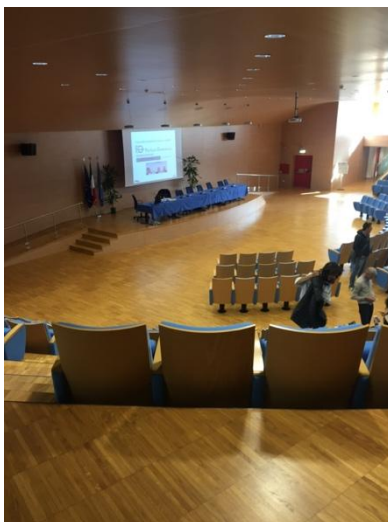
Foto 1 - Lezioni in materia di lavori pubblici presso la sede della Regione Friuli Venezia Giulia