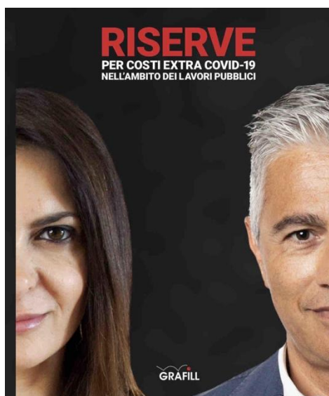
2020Co-Autore Libro " RISERVE per COSTI EXTRA COVID-19 "

2022UNIVERSITA' DEGLI STUDI DI TERAMO – FACOLTA' DI GIURISPRUDENZA – (Cattedra di Diritto Amministrativo) "LA PROGETTAZIONE NELLA MATERIA DEGLI APPALTI E DELLE CONCESSIONI TRA SCIENZA DEL DIRITTO E SCIENZE COGNITIVE: ALLA RICERCA DI UN APPROCCIO MULTIDISCIPLINARE"