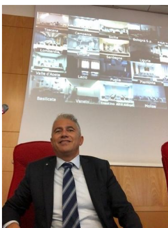
Foto 3 – INPS – Direzione Generale- Lezione in videoconferenza con le Direzioni Regionali in materia di appalti pubblici -2019

Durante il Dottorato di ricerca sono state svolte lezioni in materia di LL.PP. presso L'università Politecnica delle Marche – Facoltà di Ingegneria- Istituto IDAU ( Prof. Berardo Naticchia) e presso strutture esterne ( es. Banca di Italia –Roma Direzione Generale)