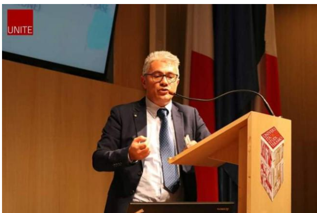
Foto 4 - Convegno Università di Teramo 14 marzo 2019